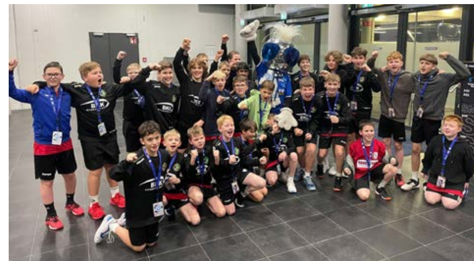
gJD: Event in der Porsche-Arena

Trotz des frühen Turnierbeginns um 08.15 Uhr waren die Minis hellwach und konnten alle Turmballs Spiele für sich entscheiden. Beim Koordinationsparcours konnten die Youngsters nicht ganz so gut abliefern. Dennoch strahlten alle bei der