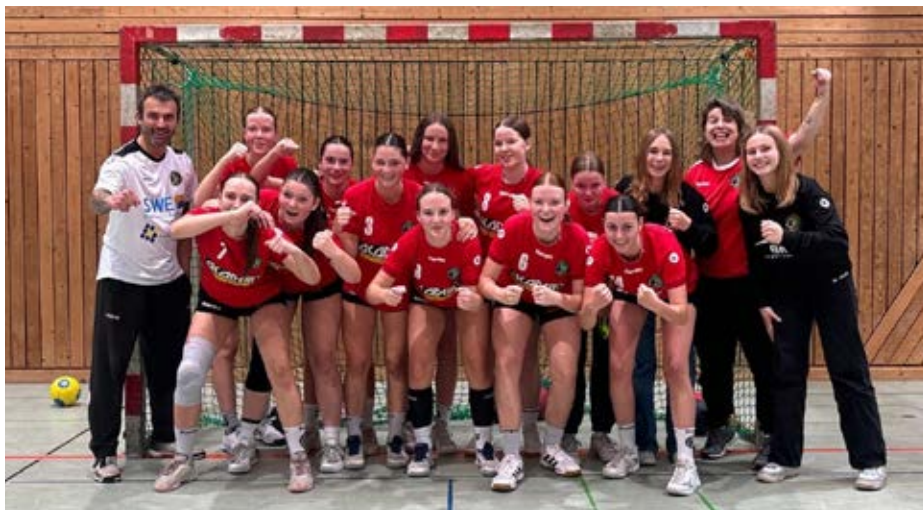
wJB beim Spieltag

Siegerehrung und freuten sich über einen tollen 6. Platz und über die mehr als verdienten Medaillen! Im Anschluss an das Miniturnier startete die F-Jugend durch. Beim Turmball, beim 4+1 Handball und beim Koordinationsparcours konnten jeder zeigen, was er schon gelernt hatte. Der Spaß am Handball steht im Vordergrund und die Kinder konnten umsetzen, was sie im Training schon alles gelernt haben! Die Nord Mannschaft belegte einen super 10. Platz, die Südmannschaft freute sich mit dem 15. Platz über ihre allererste Turnierteilnahme überhaupt.