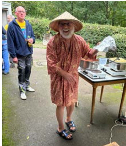
Ali aus Bali

Der Mittwoch Arbeits-Dienst der TSG Esslingen