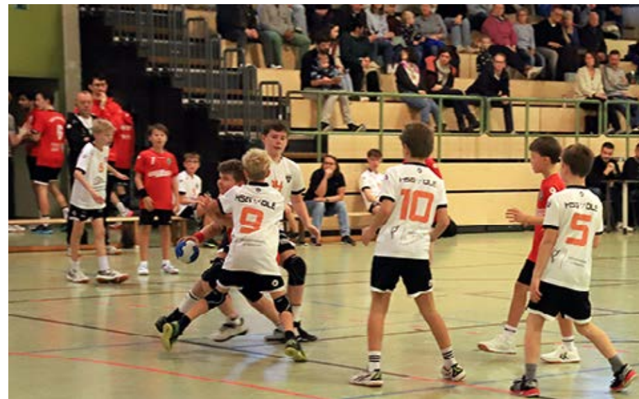
gJD2 beim Spieltag

Die mJB spielt in diesem Jahr in der Bezirksliga und belegt momentan den 3. Tabellenplatz. Auch hier geht der Blick nach oben in der Tabelle.