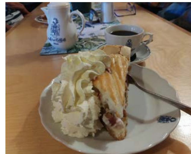
Hier wird jeder satt

Im Juli und August trafen wir uns wieder zum Mittagessen im Waldheim und im Dulkhäusle.