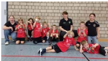
Minis und F-Jugend beim Turnier in Neckartenzlingen

Siegerehrung und freuten sich über einen tollen 6. Platz und über die mehr als verdienten Medaillen! Im Anschluss an das Miniturnier startete die F-Jugend durch. Beim Turmball, beim 4+1 Handball und beim Koordinationsparcours konnten jeder zeigen, was er schon gelernt hatte. Der Spaß am Handball steht im Vordergrund und die Kinder konnten umsetzen, was sie im Training schon alles gelernt haben! Die Nord Mannschaft belegte einen super 10. Platz, die Südmannschaft freute sich mit dem 15. Platz über ihre allererste Turnierteilnahme überhaupt.